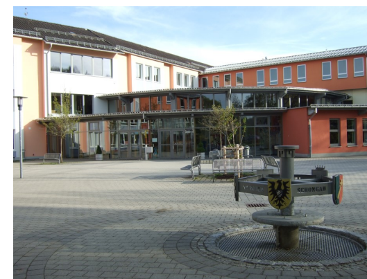
Seit 2020/21: offene Ganztageschule